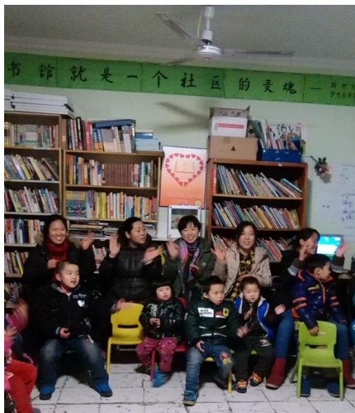
亲子阅读工作坊，“流动子弟儿童阅读习惯养成计划”，北京新世纪梦想图书馆

北京新世纪梦想图书馆的《流动子弟儿童阅读习惯养成计划》项目针对外来务工人员社区进行了亲子阅读推广和培训，提供了核心阅读书目、阅读指导手册、和一个包含 24 个课时的工作坊。通过参与家庭的阅读日记，我们发现参与的 60 个家庭大部分都对早期教育和亲子阅读有了更深的理解，超过 2/3 的家庭已经形成了亲子阅读的习惯，也掌握了基本的亲子阅读方法。