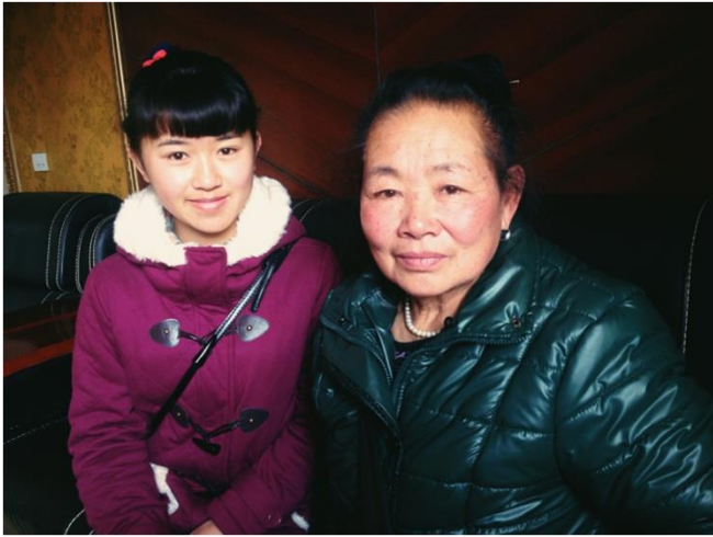
学生采访侗族老人，“黔东南侗族民间故事搜集”，贵州凯里一中

3个项目属于民俗和民间文学艺术的探究，但各有不同侧重。新华中学的《花儿人生——天祝民间花儿艺人生活史访谈》是建立在2012《天祝花儿》口述史项目对花儿这种艺术形式本身的探究之上，力图搜集艺人/爱好者的生活史史料，以构建这一本土民俗艺术与当地人的人生之关系的理解，深入挖掘其文化内涵。而这样一种深度访谈，较之就花儿本身的访谈，更富挑战性。在这个项目中项目团队花了不少精力和心思建立了和广场花儿群(老年群)和QQ花儿群(中年群)的信任和融洽关系，对几位“引见”人物进行了深度访谈，为后续由更多学生参加、对这两个群体更多艺人的访谈打下了很好的基础。此学校的《天祝土族民俗探究》则利用了学生的人脉资源，深入土族村庄，对土族婚俗和做寿民俗进行了全程实录，并制作了纪录片。尤其是婚俗部分，仪式繁缛，其服饰、角色、程序、歌谣说唱等，是只有口头语言的土族重要的文化传承场。阅读土族民俗相关资料、参与这一实录和视频制作使得土族学生对自己的民族之根从不了解到珍视，也使得其他学生为当地瑰丽的多元民族文化所折服。凯里一中的《黔东南侗族民间故事搜集》则是引导学生搜集家乡的民间故事，阅读有关侗族文化和民间故事的图书并写读后感，利用节假日回老家的机会采访身边的人讲述侗族民间故事，博客展示学生的读后感和采访到的故事，进行交流分享