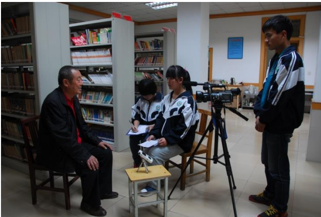
访谈退休教师，“丹凤中学发展变迁口述史”，陕西丹凤中学

3个项目属于民俗和民间文学艺术的探究，但各有不同侧重。新华中学的《花儿人生——天祝民间花儿艺人生活史访谈》是建立在2012《天祝花儿》口述史项目对花儿这种艺术形式本身的探究之上，力图搜集艺人/爱好者的生活史史料，以构建这一本土民俗艺术与当地人的人生之关系的理解，深入挖掘其文化内涵。而这样一种深度访谈，较之就花儿本身的访谈，更富挑战性。在这个项目中项目团队花了不少精力和心思建立了和广场花儿群(老年群)和QQ花儿群(中年群)的信任和融洽关系，对几位“引见”人物进行了深度访谈，为后续由更多学生参加、对这两个群体更多艺人的访谈打下了很好的基础。此学校的《天祝土族民俗探究》则利用了学生的人脉资源，深入土族村庄，对土族婚俗和做寿民俗进行了全程实录，并制作了纪录片。尤其是婚俗部分，仪式繁缛，其服饰、角色、程序、歌谣说唱等，是只有口头语言的土族重要的文化传承场。阅读土族民俗相关资料、参与这一实录和视频制作使得土族学生对自己的民族之根从不了解到珍视，也使得其他学生为当地瑰丽的多元民族文化所折服。凯里一中的《黔东南侗族民间故事搜集》则是引导学生搜集家乡的民间故事，阅读有关侗族文化和民间故事的图书并写读后感，利用节假日回老家的机会采访身边的人讲述侗族民间故事，博客展示学生的读后感和采访到的故事，进行交流分享