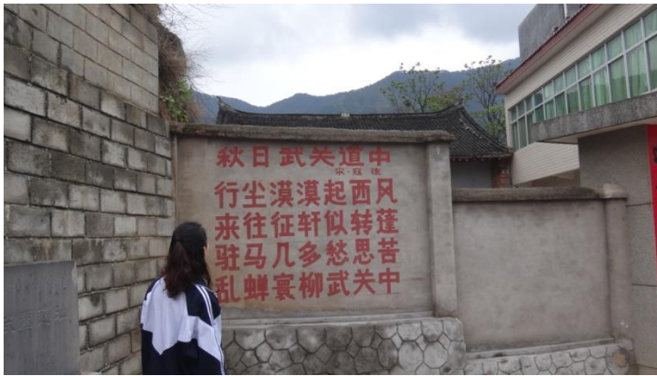
学生在读武关遗址的墙头诗，“本土文化与古诗词阅读”，陕西丹凤中学

本年度的阅读项目已从“读书“拓展到”行路“。在丹凤中学《本土文化与古诗词阅读》项目中，教师组织和指导学生查阅本土诗词和相关历史文化背景资料，并就诗词所吟诵之历史地点或事件，如当地古关隘，进行实地考察。学生综合阅读和考察所得，分析古诗歌内涵，写出读后感或评鉴文章。师生共同考察，同题写作，交流促进。从学生作品中，我们看到学生对古诗文的鉴赏力之提升，本土历史文化对学生的滋养，以及学生和家乡情感联结的加深。在项目评估和反思中，我们也和项目团队一起探讨了后续的两个可能方向来加强学生的研究能力和思辨能力，一是文史不分家，评鉴文章在品评历史的同时，暴露了学生”论从史（证）出“等历史探究能力的不足，项目再深入可以演变为一个历史探究和写作；二是可将探究的面拓宽为本土文化的各个方面，如本地方言、饮食文化等，更贴近学生生活，易于他们自己去走访和发现，培育桌面研究之外的研究能力。