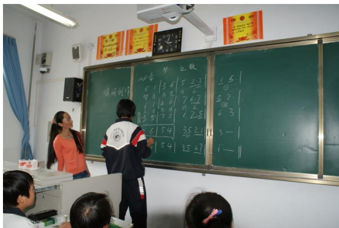
学生在填词创作，“校园乐曲填词创作室”，甘肃通渭一中

本年度的阅读和写作项目也开始了和艺术教育相结合的尝试。通渭一中的《校园乐曲填词创作室》由语文教师协同计算机教师和音乐教师设计，与音乐社团合作。60 名学生组成小组，通过阅读相关书籍、网上学习歌曲实例、及教师培训和指导下的填词和视唱练习来学习歌词创作，还通过校园歌曲歌词征集活动和歌手大赛促进学生之间的交流，吸引更多的学生参加和关注。通渭一中的《提高艺术鉴赏力的阅读》项目则将阅读和写作与音乐鉴赏相结合，鼓励学生们对各自感兴趣的音乐形式和作品进行聆听鉴赏，阅读其产生的历史背景、艺术发展脉络和手法评价，并在此基础上通过写作，表达自己的聆听感受和对其中内涵和价值的理解。