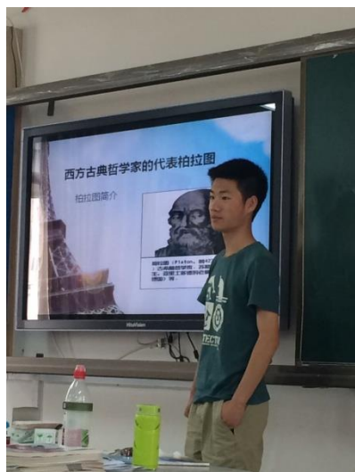
学生在授课演讲竞赛中，“以班级为单位试点阅读和探究性学习建设”，贵州凯里一中

构策略》是课堂科学探究的典型例子。虽然学习过程是针对问题的探究（比如正午太阳高度角如何计算），且能够和实际应用做些结合（比如正午太阳高度角可用于推导住宅公寓楼最小楼间距等），但探究设题不是来源于生活的开放式的问题，而是课本上的知识点，是教师完全知道答案的题目，所以真正开放式探究的成分少，学生的创造性激发得不够。而真实生活问题设题很可能需要教师引导学生调动各类知识和技能进行跨学科探究，需要结合社会的专业资源，如何做还需要青树学校摸索。