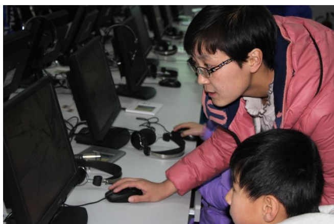
小学生在电脑报制作课上，“少儿电脑报”，通渭县图书馆

北京新世纪梦想图书馆的《流动子弟儿童阅读习惯养成计划》项目针对外来务工人员社区进行了亲子阅读推广和培训，提供了核心阅读书目、阅读指导手册、和一个包含 24 个课时的工作坊。通过参与家庭的阅读日记，我们发现参与的 60 个家庭大部分都对早期教育和亲子阅读有了更深的理解，超过 2/3 的家庭已经形成了亲子阅读的习惯，也掌握了基本的亲子阅读方法。